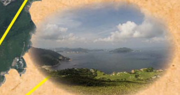
龍脊望石澳鄉村俱樂部