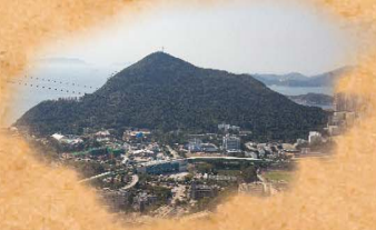
遠望黃竹坑、海洋公園景色