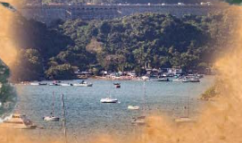
遠望大潭篤水塘水壩