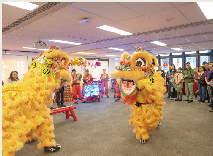
港島地域丙午年新春團拜