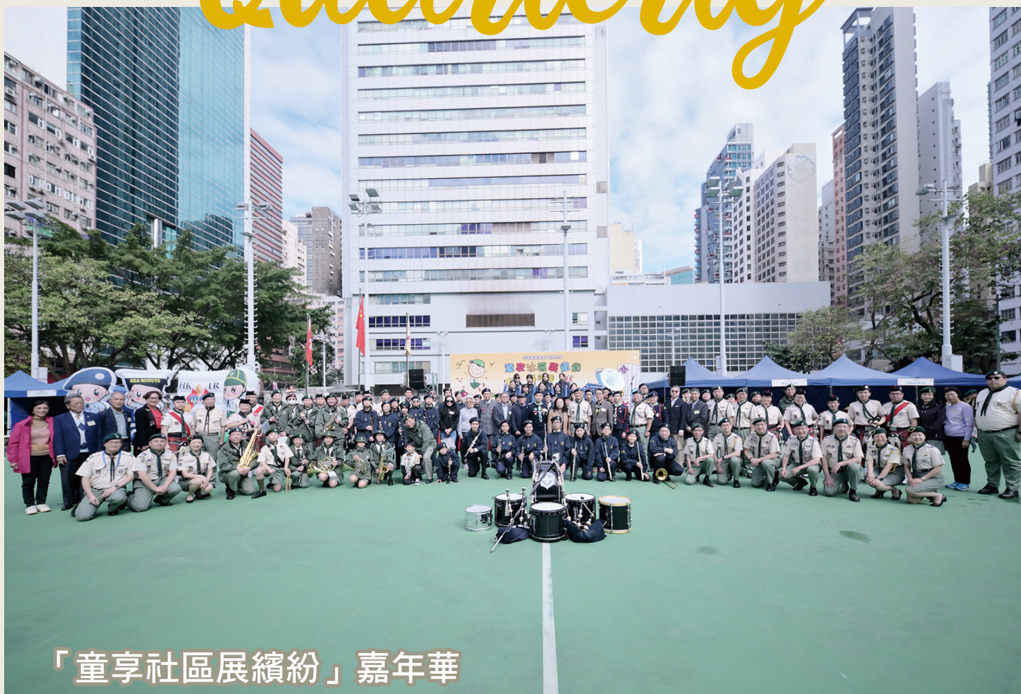
「童享社區展繽紛」嘉年華