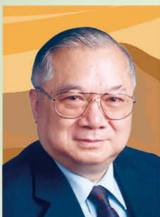
胡應湘爵士, GBS, KCMG